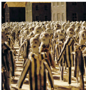
Il plastico che rappresenta il lager

Kamp è stato definito «una forma di rappresentazione alle volte veritiera altre astratta, con una messa a fuoco sulla storia sia da vicino che da lontano. In altre parole, in grado di generare una forma d'identificazione moderata e riflessiva, lontano da tutte le più facili emozioni. Le figure sono create in argilla, le facce, tutte diverse tra loro, si basano sull'opera il "Grido" di Munch. I corpi in filo di ferro sono rivestiti con il pigiama a righe diventano trasparenti quando sono gettati in una sorta di resina, con l'arrivo della camera a gas».