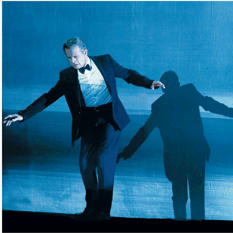
Mikhail Baryshnikov diretto da Robert Wilson

Geniale quanto innovativo sul palcoscenico, nel privato invece l'artista conduce una vita burrascosa che avrà pesanti ripercussioni sulla sua carriera: inizialmente legato con il ricco mecenate Sergej Djagilev, in seguito sposa la contessa ungherese Romola de Pulszky ma il rapporto si deteriora con gli anni conducendolo dritto alla follia e al ricovero in un istituto di psichiatria. Wilson analizza i vari episodi di cui si rende protagonista Nijinsky invitando lo spettatore a riflettere