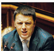
Determinato il premier Matteo Renzi