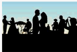
Da sinistra, La dolce vita, Juliette Gréco, Raphael Gualazzi e Tosca