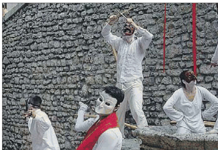
La MaMa Spoleto Open In scena la performance liberamente ispirata a Il Piccolo Principe