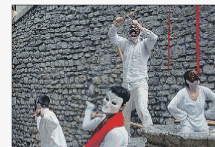
La MaMa Spoleto Open in scena la performance liberamente ispirata a Il Piccolo Principe

mana Internazionale della Danza, con la sua giovanissima e affascinante compagnia umbra Inc InProgress Collective. Per raggiungere La MaMa Umbria sarà messo a disposizione del pubblico un servizio navetta gratuito.