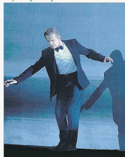
Prime Baryshnikov questa sera a Spoleto in Letter to a man