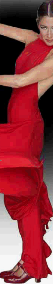
DIVA La celebre ballerina di flamenco Sara Baras ("Voces" al Teatro Romano il 27 e 28 giugno)