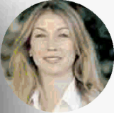
ELEONORA ABBAGNATO Al Teatro Romano, dal 3 al 5 luglio, in "Soirée Roland Petit"