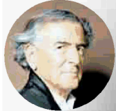
BERNARD-HENRI LEVY Al Caio Melisso con il suo "Hotel Europe", il 27 giugno