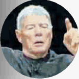
JEFFREY TATE Il 12 luglio, Concerto in Piazza con l'Orchestra di Fiesole