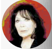
JULIETTE GRECO Il 10 e 11 luglio al Teatro Nuovo con il recital "Mercei"