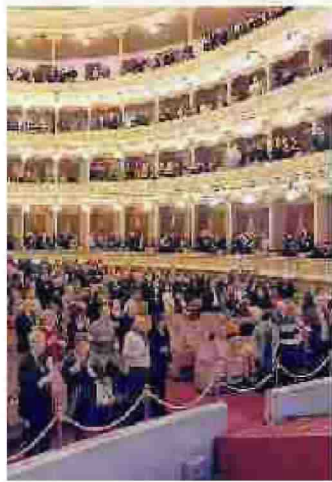
Il Coccia progetta il futuro